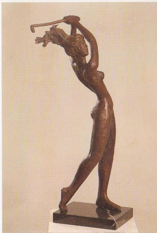
JUGADORA DE GOLF (58 x 20 x 12)

El bronce asegura la firmeza permanente a través del tiempo. Esta es la gran clave ofrecida por la escultora Maite Defruc, en posesión definitiva de la compleja técnica de la cera perdida , que tanta precisión artesanal exige al artista.