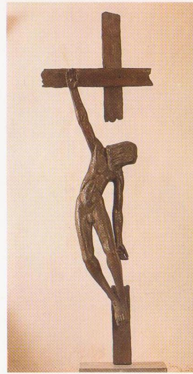
CHRIST BRISÉ (2,60 x 0,60 x 0,20) Ossuaire de DOUAI-MONT - VERDUN (FRANCE)