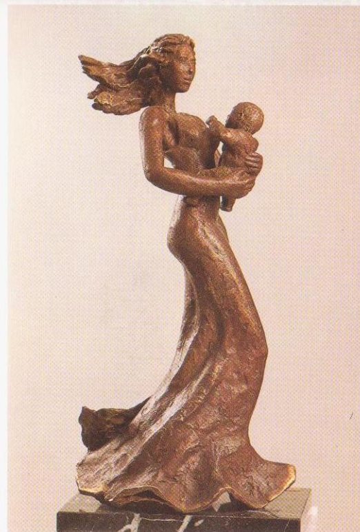
MADRE (55 x 25 x 16)