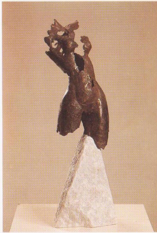
MUJER (27 x 10 x 7)

Bronze gewährleistet stetige und zeitlose Kraft. Dies ist der Schlüssel für die Arbeiten der Bildhauerin Maite Defruc, denn sie beherrscht wie kaum jemand die schwierige Technik des verlorenen Wachses , die dem Künstler so viel Präzision abverlangt.